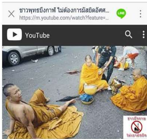
ชาวพุทธบึงกาฬ ไม่ต้องการมัสยิดอัศศอบีรีน ในอำเภอปากคาด เอาจันออกไปซะ วิระหุ โมเดล · 1,876 views