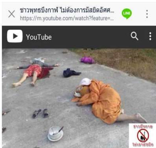
ชาวพุทธบึงกาฬ ไม่ต้องการมัสยิดอัศศอบีรีน ในอำเภอปากคาด เอาจันออกไปซะ วิระหุ โมเดล · 1,876 views