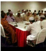
ข่าวด่วน พระหรือคนมาร

พุทธอิสระเมื่อวาน นั่งล้อมา. บินรอบ วัดพระธรรมกาย เมื่อคืน ไปประชุม กับอิสลาม นี่อะไรกัน. นายกกำลังทำอะไร