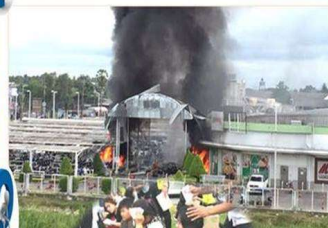
9 พ.ค.60 ห้างพุทธโดนระเบิด

เมื่อ 091407 พ.ค.60 คนร้ายลอบวางระเบิด (car bomb) ในบริเวณห้างบิ๊กซี อ.เมือง จ. บัตตานี เมืองต้นมีรายงานผู้ได้รับบาดเจ็บ 45 ราย และรถเสียหายนับร้อยคัน