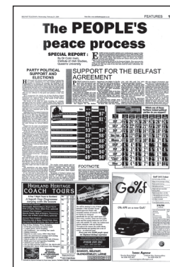
▪ Belfast Telegraph , 21 February 2001