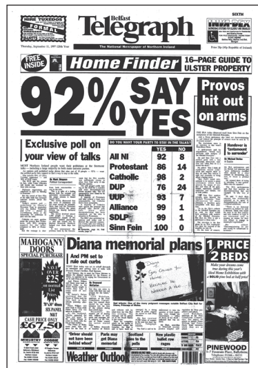
▪ Belfast Telegraph , 11 September 1997