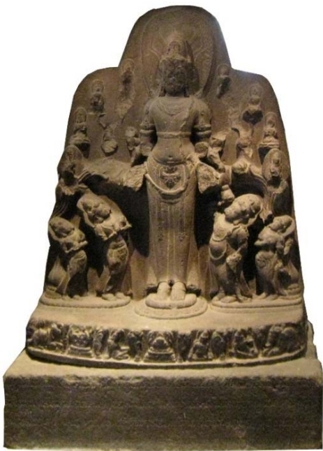
ภาพที่ 1: จารึกปาดังโรโค (Padang Roco Inscription) ที่ฐานเทวรูป

ของอาณาจักรศรีวิชัยโดยราชวงศ์ไศเลนทร์ที่มีเหนือสุมาตราและคาบสมุทรมลายูจากเหตุการณ์โจมตีของกองทัพโจฬะที่นำโดยพระเจ้าราเชนทร์โจฬะในปี.ศ.1568 | ค.ศ.1025 ซึ่งในทีนี้ อาณาจักรธรรมสระยะก็ถือได้ว่าเป็นการสืบทอดอำนาจเดิมต่อเนื่องมาจากราชวงศ์ไศเลนทร์แห่งศรีวิชัย ทั้งนี้ ข้อความในจารึกที่ได้กล่าวถึงชื่อว่า “ภูมิมลายู ( Bhūmi Mālayu )” ซึ่งหมายความว่า “ดินแดนมลายู” รวมทั้งปรากฏคำกล่าวถึง “สุวรรณภูมิ ( Suvarn Bhumi )” ซึ่งในทีนี้สันนิษฐานว่ามีการกำหนดชื่อใหม่ที่ยังพยายามเชื่อมโยงกับชื่อเดิมที่เรียกกันในเอกสารอินเดียว่า “สุวรรณทวีป ( Suvarn Dvīpa )” ซึ่งสันนิษฐานว่าหมายถึงเกาะสุมาตราด้วยนั่นเอง